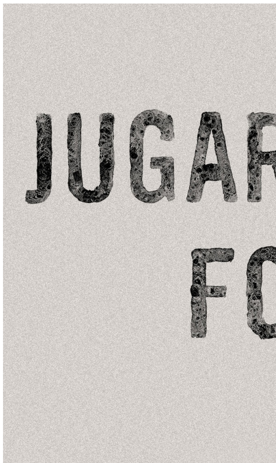
Cartell de l'exposició "Jugar amb foc" que es pot visitar al Museu de la Vida Rural fins el juny de 2021.

Potser, només potser, la figura femenina del quadre de Palau Ferré copsa la immensitat del foc.